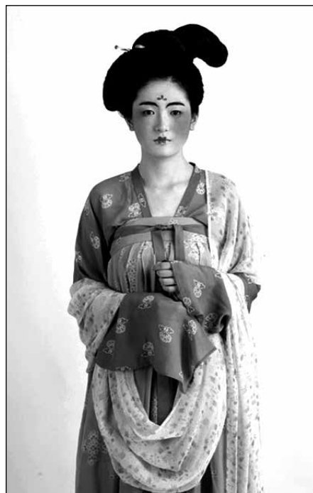
Фигура 3 Жуцюн през епоха Тан

По това време се появява и нов тип долна дреха – хъдзъ Нѐ зї (诃子), първата такава без презрамки. Хъдзъ се закопчава с копчета отпред и е направена от тежка, леко еластична материя. През по-късните етапи на епохата жените започват да избягват ризата и носели само хъдзъ , полата и шал. Това обаче им било позволено само в уединението на домовете им, а когато се появявали на публично място, трябвало да носят риза под хъдзъ .