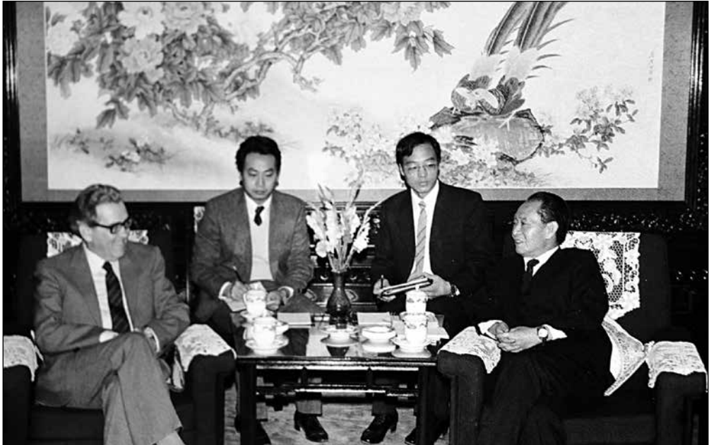
Среща на българската парламентарна делегация начело с председателя на НС Станко Тодоров с генералния секретар на ЦК на ККП Ху Яобан, 8 ноември, 1985 г. По: 中国和保加利亚建交60周年. 2009, с. 32.