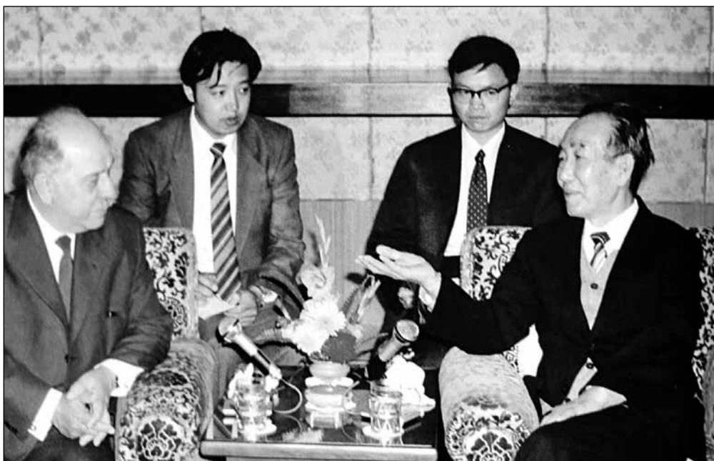
Среща на члена на Политбюро на ЦК на БКП и председател на Националния комитет на ОФ Пенчо Кубадински със зам.-председателя на КНПКС Уан Жънджун, май 1988 г. По: 中国和保加利亚建交60周年. 2009, с. 36.