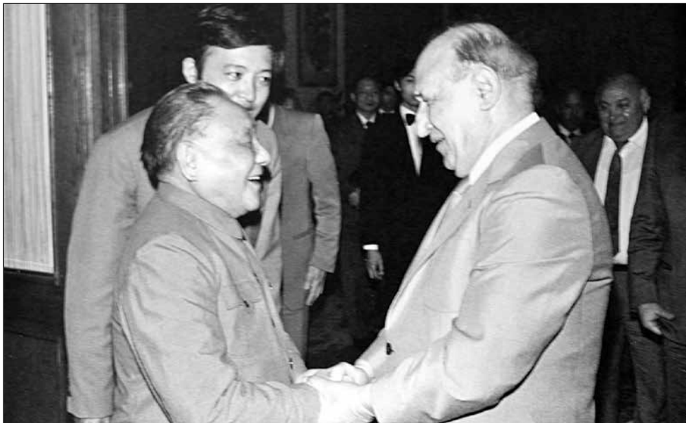
Историческата среща между генералния секретар на ЦК на БКП и председател на Държавния съвет на НРБ Тодор Живков с председателя на Комисията на съветниците при ЦК на ККП Дън Сяопин, 7 май 1987 г. в Дома на ОКШП. По: 中国和保加利亚建交60周年. 2009, с. 35.