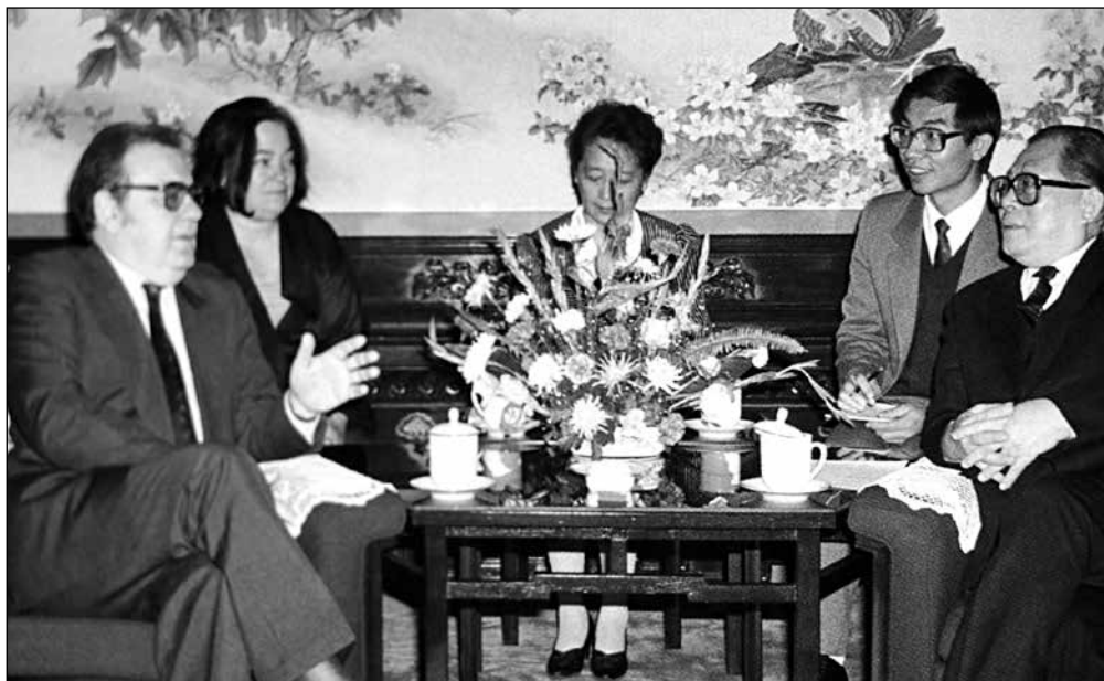
Среща на външния министър Петър Младенов с генералния секретар на ЦК на ККП Дзян Дзъмин в правителствената резиденция „Джуннанхай“, 07.11.1989 г. По: 中国和保加利亚建交60周年. 2009, с. 38.