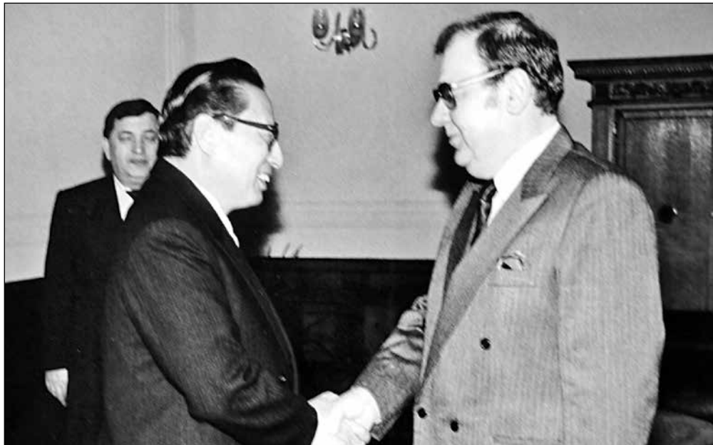
Новоизбраният секретар на ЦК на БКП Петър Младенов приема китайска правителствена делегация, водена от Чао Шъ, член на Постоянния комитет на ЦК на ККП и член на Секретариата на ЦК на Партията, края на ноември 1989 г. По: 中国和保加利亚建交60周年. 2009, с. 39.