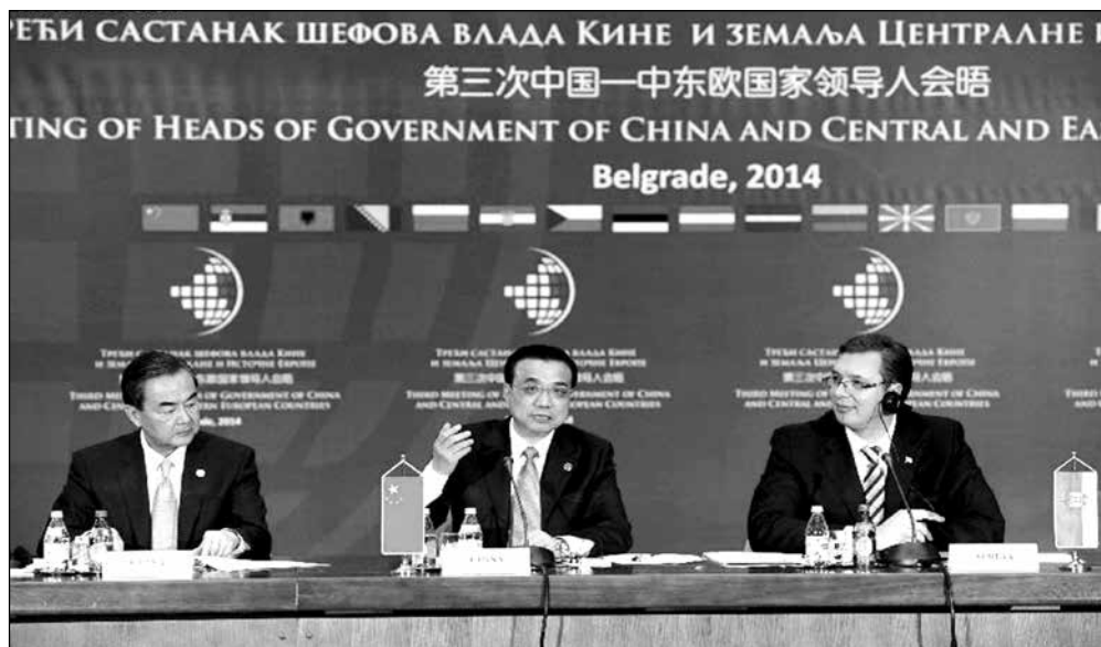
Третата среща на високо равнище във „Формата 16 + 1“ в Белград през 2014 година, на която от китайска страна присъства Ли Къцян

Следва да се подчертае фактът, че ясно напредва институционализирането на „Формата 16 + 1“. Създава се Постоянен секретариат в Министерството на външните работи на Китай през 2012 г. във връзка с „Формата 16 + 1“. През 2014 г. е формиран Постоянен секретариат за насърчаване на инвестициите във Варшава. Изградени са също няколко асоциации и браншови организации, координирани от отделните държави, например сътрудничеството в селското стопанство се координира от България, а в железопътния транспорт – от Сърбия.