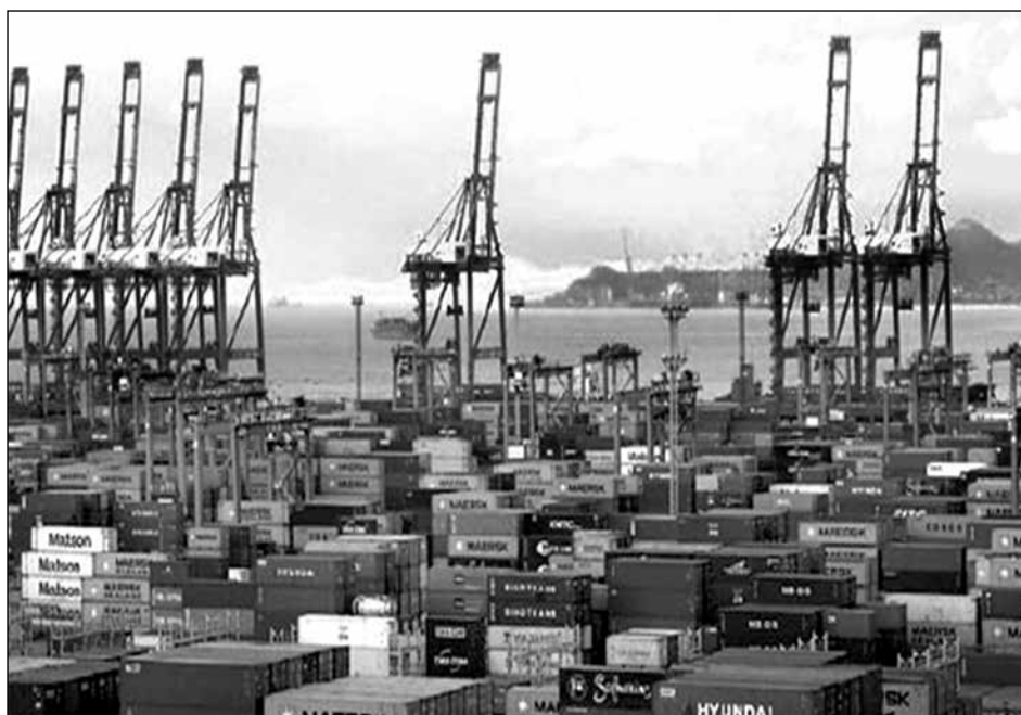
Пристанището на Нинбо, където на всеки 15 секунди се сваля контейнер от кораби и той заминава за вътрешността на страната

Така например общата сума на износа и вноса от Нинбо и 16-те страни от ЦИЕ за 2013 г. е на стойност 2.27 млрд. щ. д. За 2014 г. същата тази сума на износ и внос е 2.44 млрд. щ. д., при което се наблюдава един значителен скок в размер на 7.6%. В диаграмата по-долу са дадени как са разпределени тези общи суми по десет от 16-те страни, развиващи най-широки връзки с Китай.