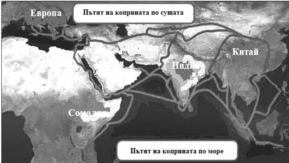
Схема на стария „Велик път на коприната“