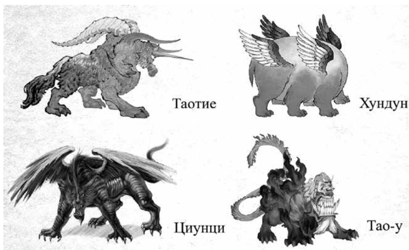
Четири зли създания

Един от мотивите, които срещаме върху бронзовите съдове от периода на китайския неолит е антропоморфното чудовище Таотие, което се отнася до „четирите зли създания на света“, заедно с Хундун (Хаоса), Циунци и Тао-у. Те се разглеждат в опозиция на четирите животни покровители на посоките – Зеления/Синия дракон, Пурпурната птица, Белия тигър и Черната костенурка Сюен-у (Тъмния боец). Според легендите четирите зловредни създания се пораждаат след смъртта на четири бунтовни предводители на древни племена: Сан Мяо, Хуан Доу, Гун Гун и Гун (бащата на Великия Ю). Те живеят във времената на митичния император Шун (2294–2184 г. пр.н.е.), а култът към тях се развива през дин. Шан (1600–1046 г. пр.н.е.). Днес образите им се срещат в литературата, киното, изобразителното изкуство, видеоигрите и др.