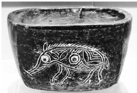
Глинена купа с изображение на свиня, култура Хъмуду (5500–3300 г. пр. н.е.)

При погребенията нерядко се срещат свински черепи и челюсти, като за пръв път подобна практика се наблюдава при културата Дади-уан, пров. Гансу, откъдето се разпространява навътре в страната към п-ов Шандун. В културата Да-уънкоу се включват и съдове куай във формата на седяща или лежаща свиня. В типологията на домашните животни у шън (Петте категории домашни животни),