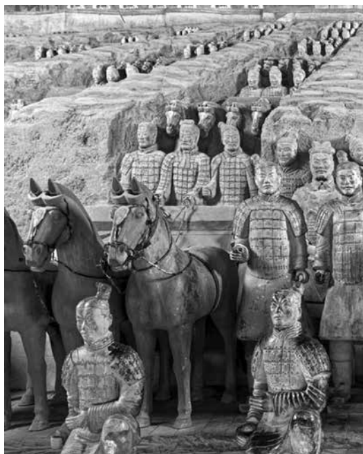
Теракотената армия на Циншъхуанди, III в. пр.н.е.

В „Книга на песните“ е запазен мотив за големия брой хора, които се принасят в жертва при смъртта на владетел. Избират се най-умелите занаятчии и представители на различни съсловия, което намалява възможностите за развитие на самата общност. Една такава песен-стих е „Жълта птичка“. В нея се споменават трима от колесничарите, принесени в жертва