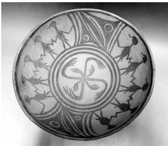
Ритуален танц, мъже с ерекция, култура Мадзя-яо (3200 – 2000 г. пр.н.е.), Лиу-уан, Лъду, пров. Цинхай

по средното течение на Яндзъ, на територията на съвременна пров. Хубей. Фалическите символи свързват култа към плодородието в тези райони с мъжкото начало и се смята, че именно този вариант на култа преминава в обредността, а покъсно в официалната система от вярвания на дин. Шан (1600–1046 г. пр.н.е.). Женското начало продължава да съществува под формата на богинята Хоуту (Повелителката земя). Олтарите в чест на земята и богинята са под формата на стълбообразни каменни валуни (Титаренко и др./ Titarenko et al. 2007: 82 – 83).