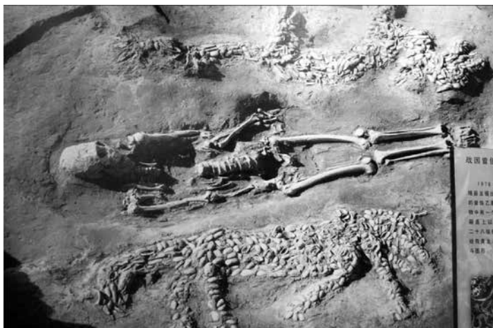
Погребение с тигър и дракон от миди каури 11 , култура Яншао, Пу-ян, пров. Хънан, ок. 4500 г. пр.н.е.

В китайската култура тигърът е повелителят на животните, затова се представя със символа за владетел уан (王), който напомня шарката на челото му. Според легендите опашката на тигъра побелява чак след като навърши 500 години, заради което се създава специален култ към Белия тигър (Байху), цар на всички митични създания, повелител и пазител на Запада. Той носи със себе си есента. Има качества като чест, доблест и смелост на война и е защитник от зловредните демони гуей .