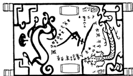
Лаково сандъче от гробницата на хоу И от царство Дзън (433 г. пр.н.е.), с изображение на 28-те съзвездия, Голямата мечка, Цинлун и Байху

Повелителят на драконите, или Богът Дракон , е китайски бог на водите и природните стихии. Отговаря за дъждовете и е зооморфен символ на дейното първоначало ян . Може да променя формата си или да приема различни образи, например на Дракона повелител на четирите морета, който е дълъг 500 м, владетел на всички останали дракони и всички водни обитатели. Подчинява се на Нефритения император. Има девет сина, сред тях е и костенурката дракон Биси. Съществуват още дракони повелители на всяко от четирите морета (братя на костенурката Ао) и отделно на всяка от главните четири реки (Рифтин/ Riftin 1990: 672).