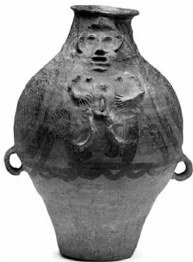
Фигура с женски гениталии, култура Мадзя-яо (3200–2000 г. пр.н.е.), Лиу-уан, Лъду, пров. Цинхай

Най-древните артефакти, свързани с култа към плодородието, са открити през 1983 г. в неолитния комплекс Хоутайдзъ, на 40 км от Пекин, датиран към VII хил. пр.н.е., и се отнасят към долните слоеве на културата Синлун-уа – най-ранната неолитна култура в Манджурия и първата, през която изработват изделия от нефрит и изображения на дракони. Открити са 20 каменни статуетки до 35 см височина, изобразяващи жени в поза „хокер“ (ембрионална поза), с подчертано закръглени кореми или в седяща коленичила поза с изобразен полов орган (Shelach 2000: 367).