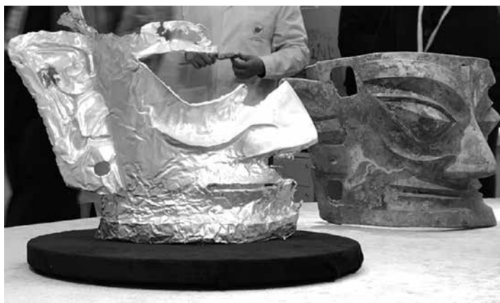
Златната маска от Сансиндуей, пров. Хънан

Най-древната до момента маска е от комплекса Бейшоулин, Си-ан, пров. Шаанси, открита през 1977 г., датирана към ср. на V – нач. на IV хил. пр.н.е. През 2021 г. в Джънджоу, пров. Хънан, е открита златна погребална маска на над 3000 г., заедно с повече от 200 златни предмета. Откритието предизвиква фурор сред археолозите, тъй като хвърля нова светлина върху ритуалите от дин. Шан.