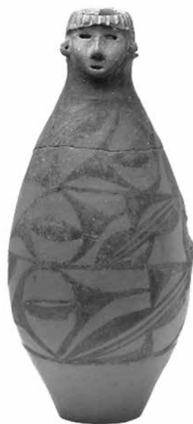
Урна уагуан със стилизирани миди каури , Банпо, Яншао, ок. 3500 г. пр.н.е.

Децата отделно се погребват в специални керамични съдове урни уънгуан и уагуан , със значително по-богато орнаментиране, релефни зооморфни изображения и сложни по композиция сцени с лов или религиозни обичаи. Възможно е това да е свързано с магическа практика на въздействие върху плодовитостта на жените – детето се дава като жертвен дар на боговете, така че мъртвите и боговете да пратят друго дете на негово място. По-богатите женски погребения могат да са доказателство и за матриархална структура на яншаоското общество. По-късно са открити и богати погребения на момчета, което показва, че те са по-скоро белег на социален статус (деца на вожда), отколкото на статус, свързан с пола.